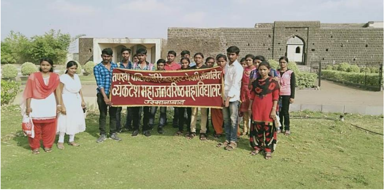
नळदुर्ग किल्ल्याच्या प्रवेशद्वारासमोर सहलीतील सहभागी विद्यार्थी-अध्यापक - नळदुर्ग सहल दि.०२.०३.१९