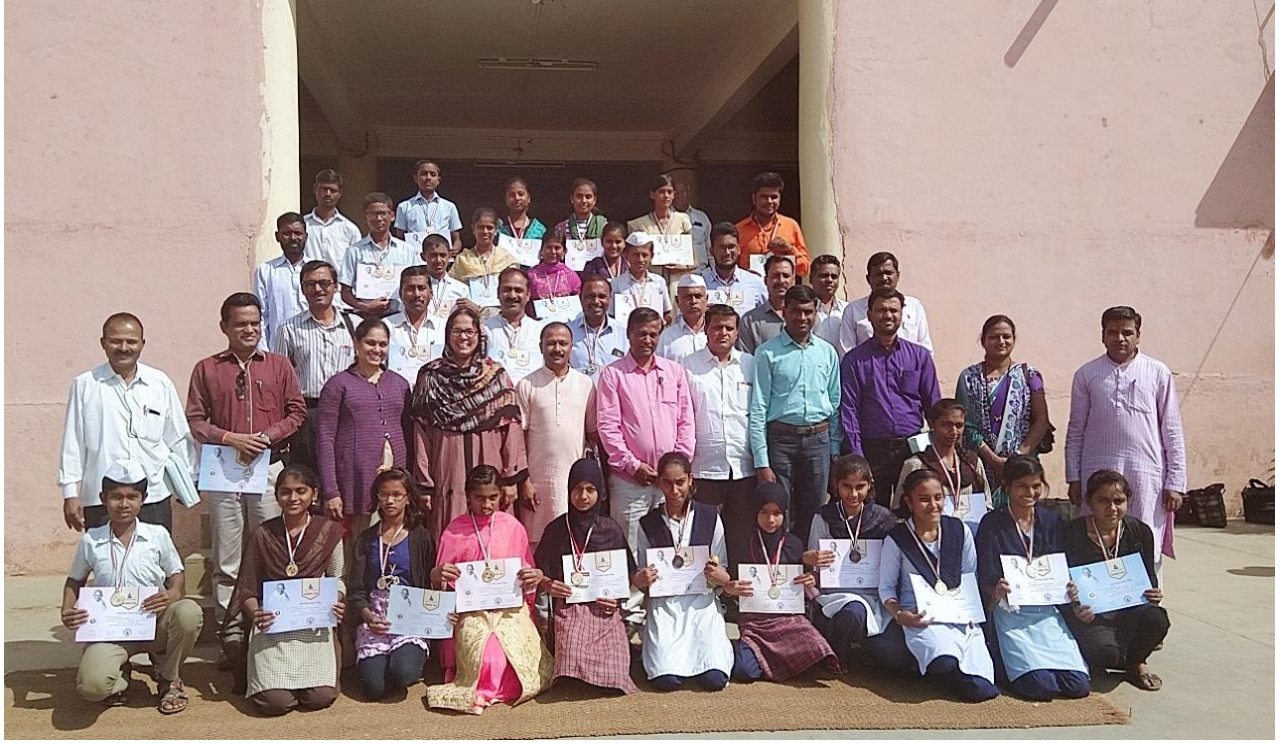
गांधी विचार संस्कार परीक्षेचे पारितोषिक वितरण कार्यक्रम : उपस्थित मान्यवर