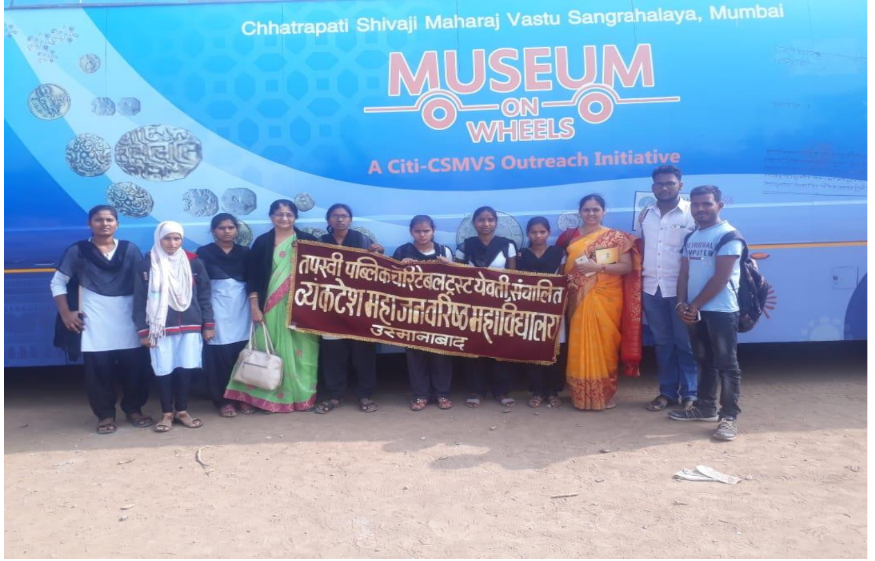
छत्रपती शिवाजी महाराज वस्तुसंग्रहालय, मुंबई, लामतुरे संग्रहालय, तेर यांच्या सहयोगाने फिरते वस्तुसंग्रहालय आयोजन दि. १७.१२.२०१८