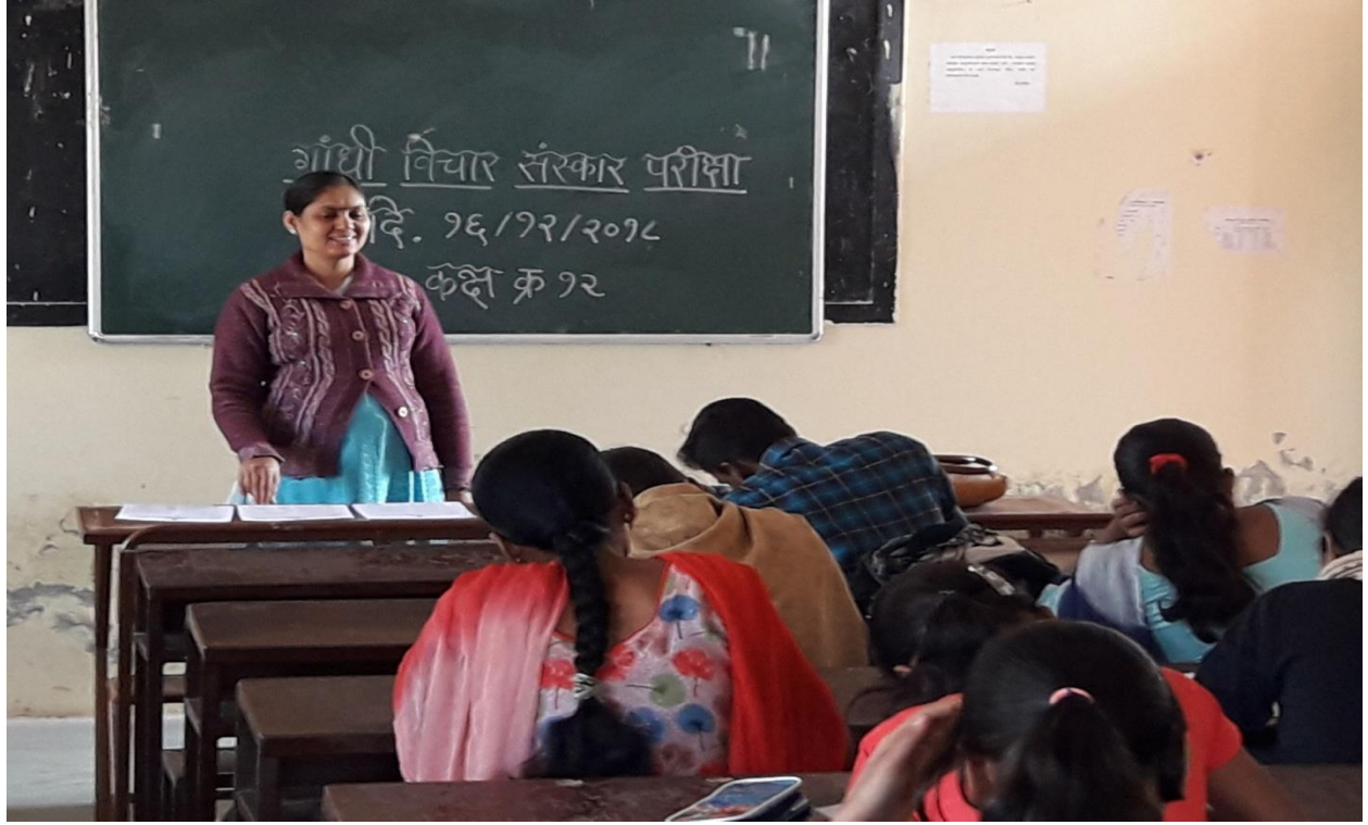
गांधी रिसर्च फाउंडेशन, जळगाव आयोजित गांधी विचार संस्कार परीक्षा-२०१८-१९ आयोजन दि.१६.१२.२०१८