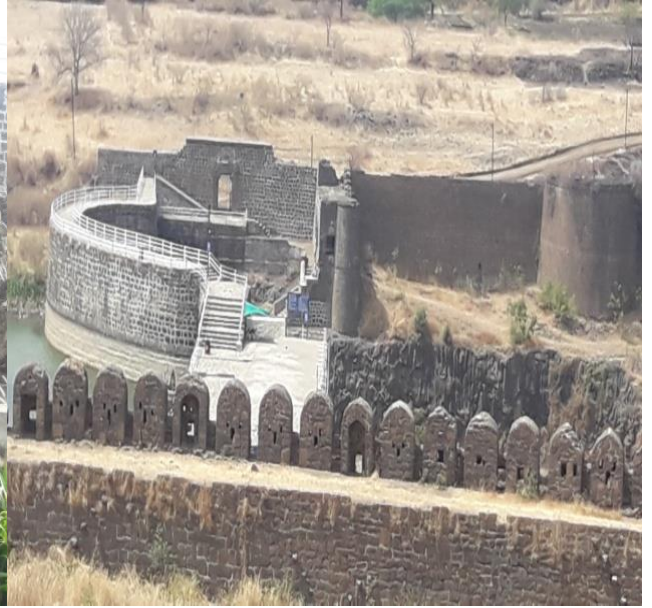
नळदुर्ग किल्ल्यावरील वास्तू-