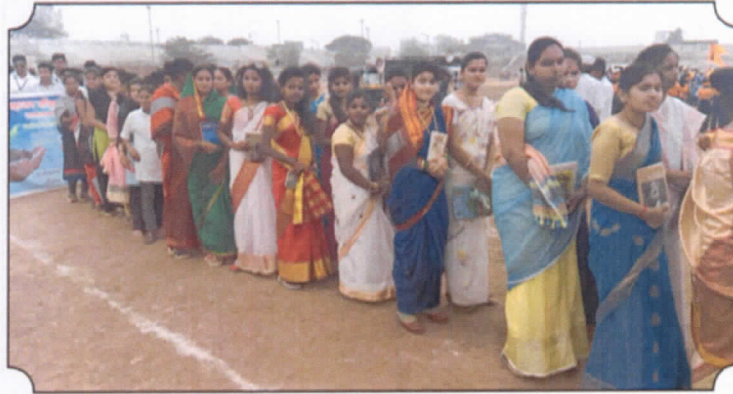
९३ वे अ.भा.साहित्य संमेलन : लेखिकांच्या पेहरावातील विद्यार्थिनी व ग्रंथदिंडीत सहभागी विद्यार्थी-शिक्षकवृंद