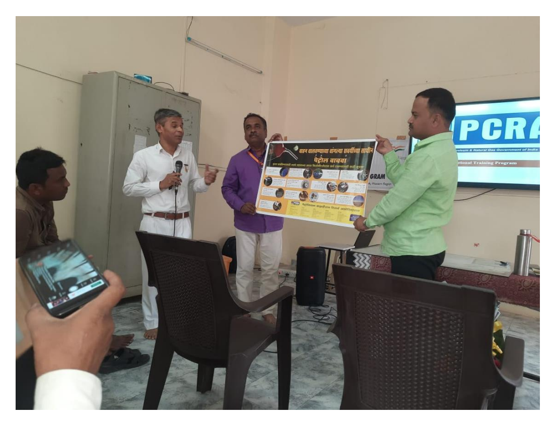
Published baner for Energy Conservation