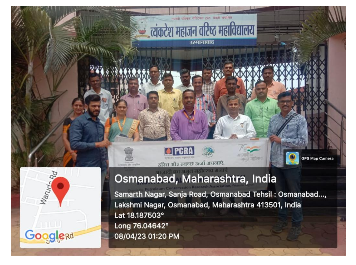
College Staff with PCRA Team