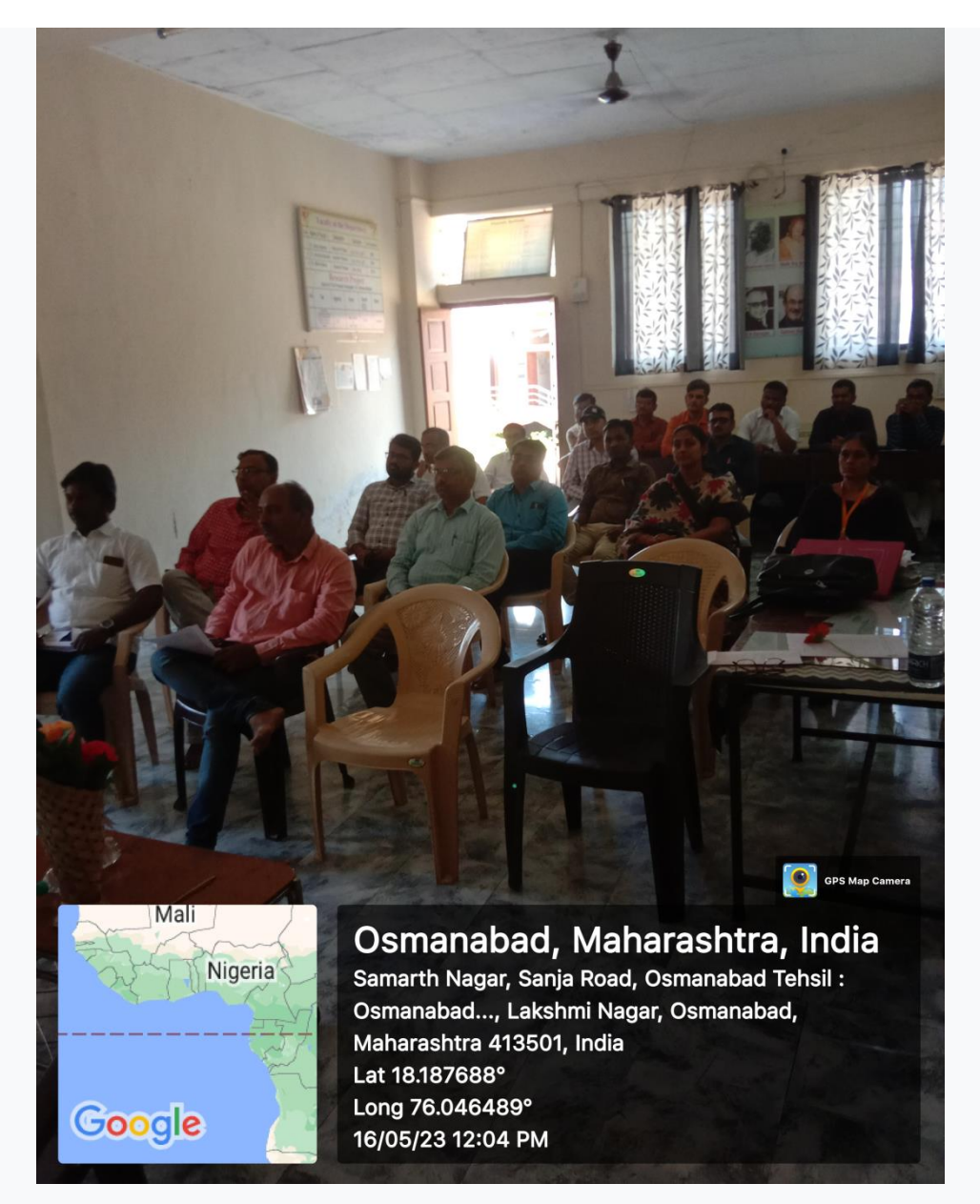
All participants present in the Programme