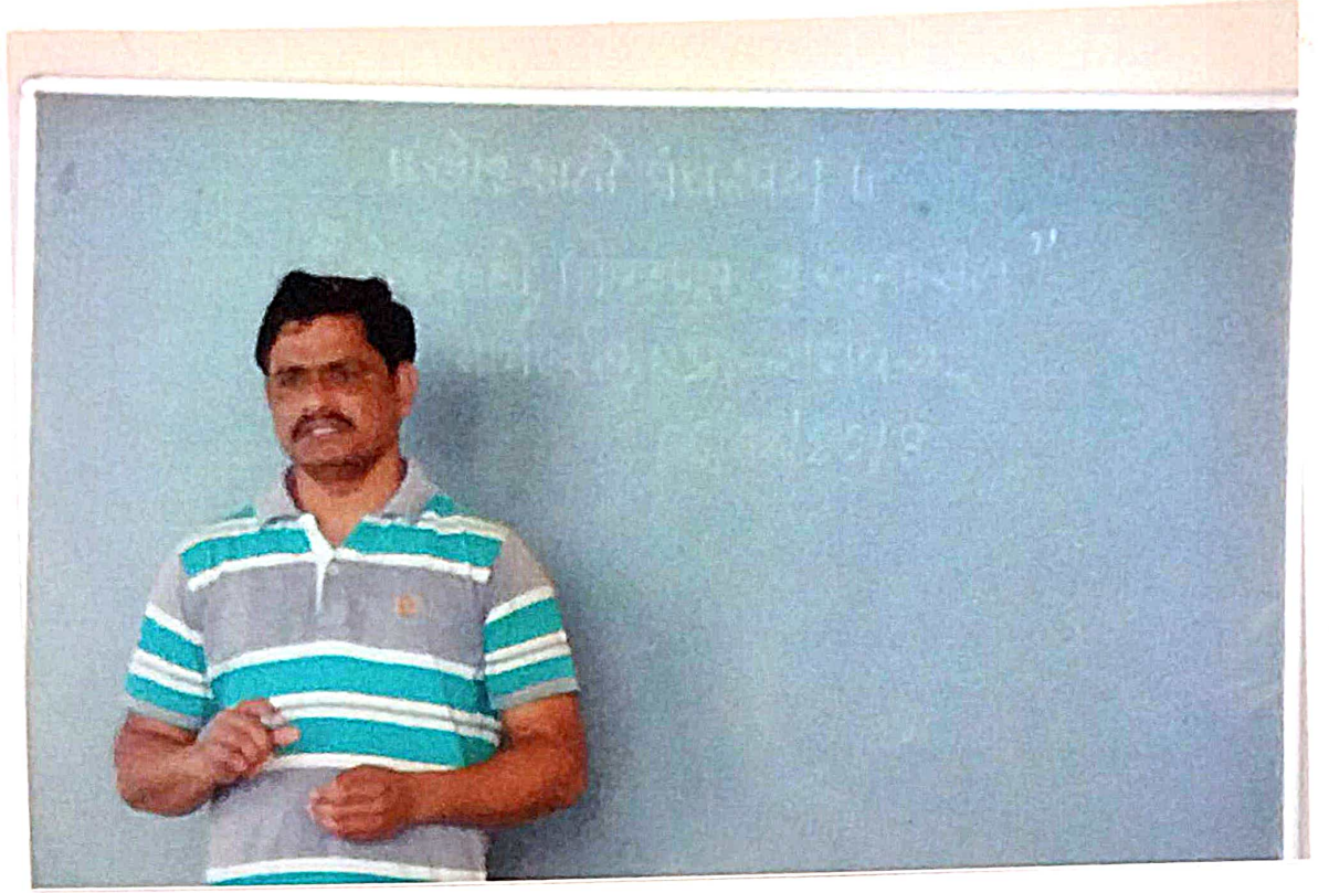
लोफशाही, निवडणुके व सुशासन या विषयावर मार्गदर्शिन छरताना प्रा. रासवे सर