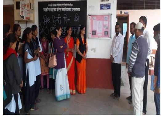
भित्तिपत्रक का अनावरण