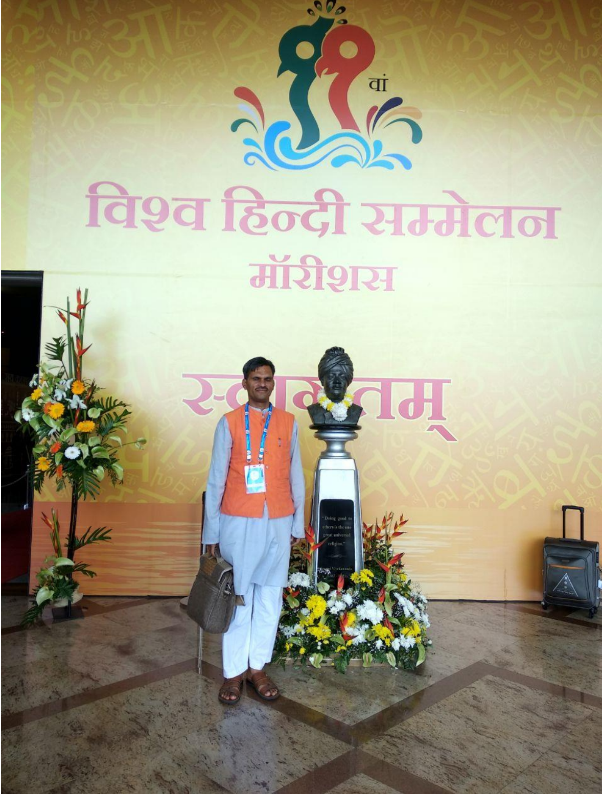
मोरिशस के ११ वें विश्व हिंदी सम्मेलन में सहभाग