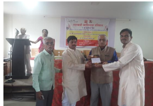
कलिदासादी वाङ्मय पुस्तक का लोकार्पण