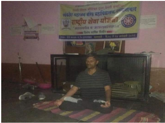
राष्ट्रीय सेवा योजना शिबिर में योगाभ्यास सत्र