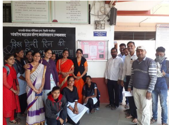
विश्व हिंदी दिन समापन सत्र