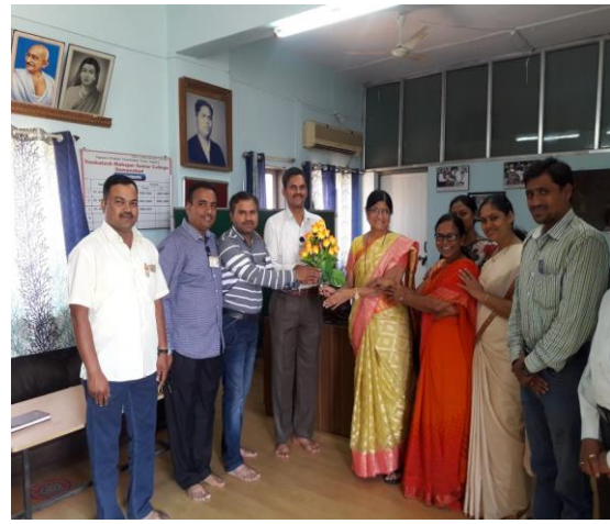
संपादक के रूप में सत्कार