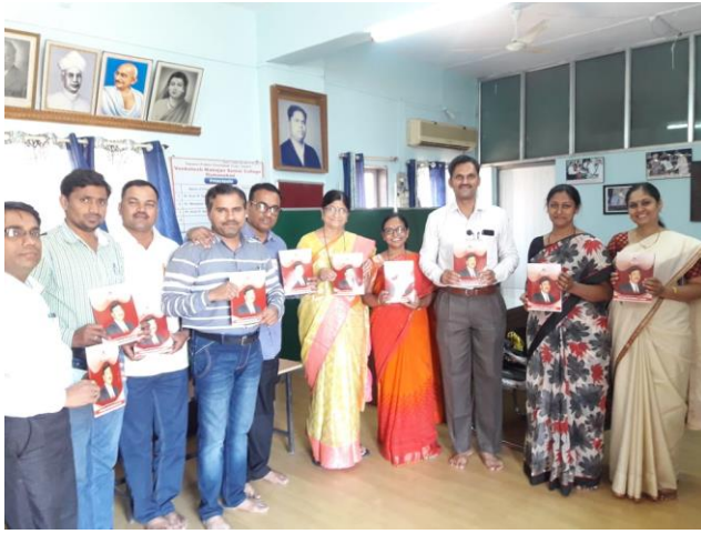
तपस्वी वार्षिकांक का प्रकाशन