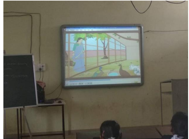
महादेवी वर्मा लिखित रेखाचित्र 'नीलकंठ मोर' पर आधारित लघु चलचित्र का प्रदर्शन कराते हुए