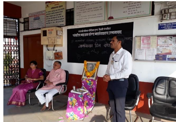
डॉ. बाबासाहेब आंबेडकर मराठवाडा नाम्बिस्तार दिन के अवसर पर व्याख्यान एवं दलित पैथर की प्रति भेंट