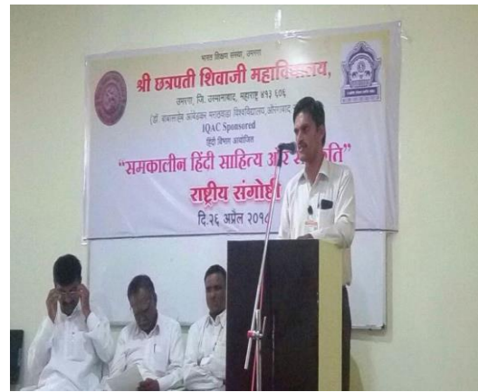
राष्ट्रीय संगोष्ठी में शोधालेख वाचन