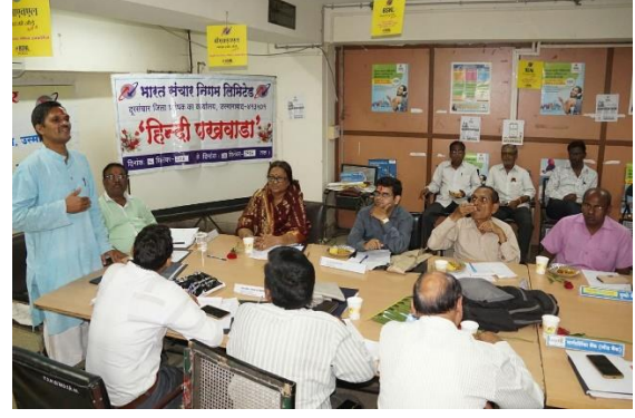
भारत संचार निगम मर्यादित, उस्मानाबाद में व्याख्यान