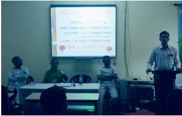
मैथिलीशरण गुप्त जयन्ती के अवसर पर रामकृष्ण परमहंस महाविद्यालय, उस्मानाबाद में प्रमुख अतिथि के रूप में