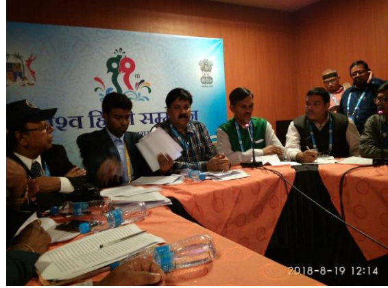
मोरिशस के ११ वें विश्व हिंदी सम्मेलन में शोधालेख वाचन