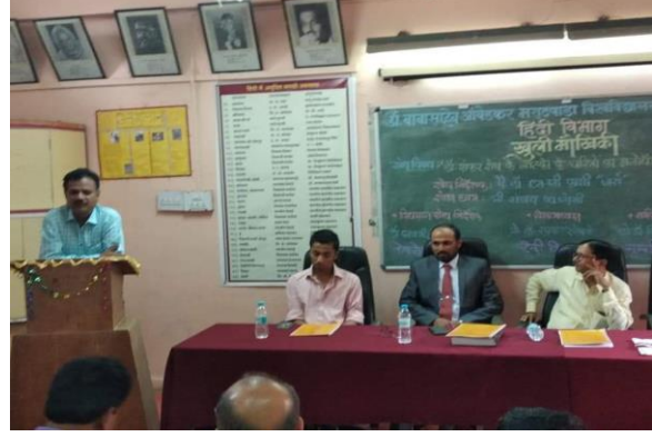
विद्यावाचस्पति की खुली मौखिकी में मार्गदर्शन करते हुए बहिस्थ