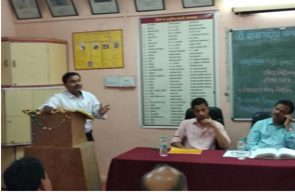
विद्यावाचस्पति की खुली मौखिकी में शोध-सार रखते हुए