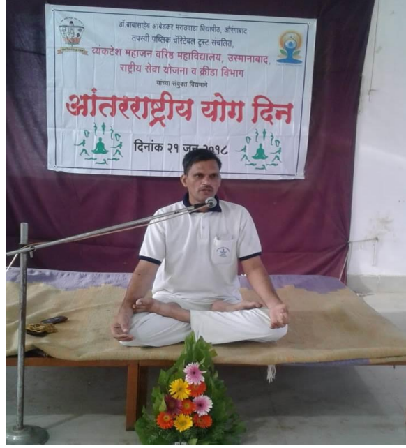
अंतर्राष्ट्रीय योग दिवस पर योगाभ्यास सत्र का आयोजन