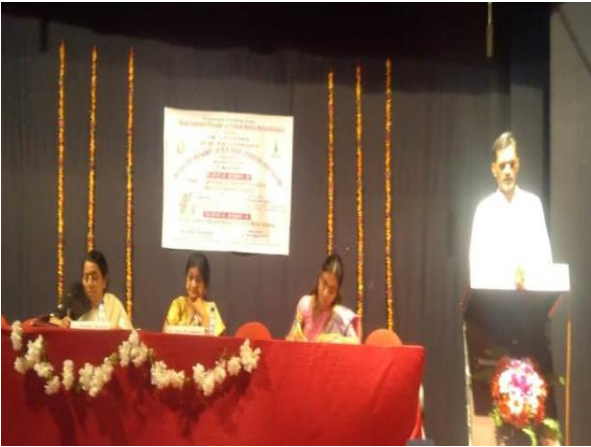
राष्ट्रीय संगोष्ठी में शोधालेख वाचन