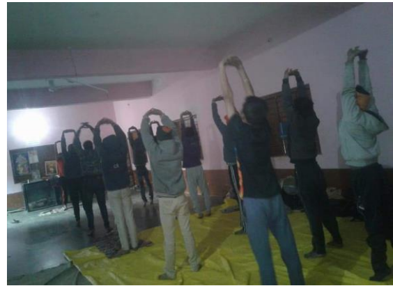
ताड़ासन करते हुए रासेयो स्वयंसेवक