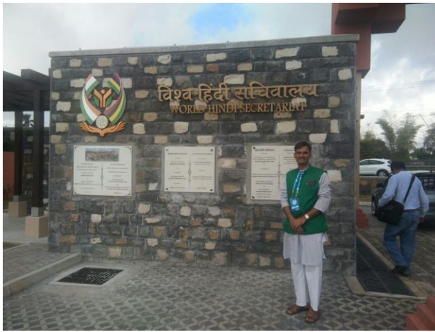
मोरिशस स्थित विश्व हिंदी सचिवालय