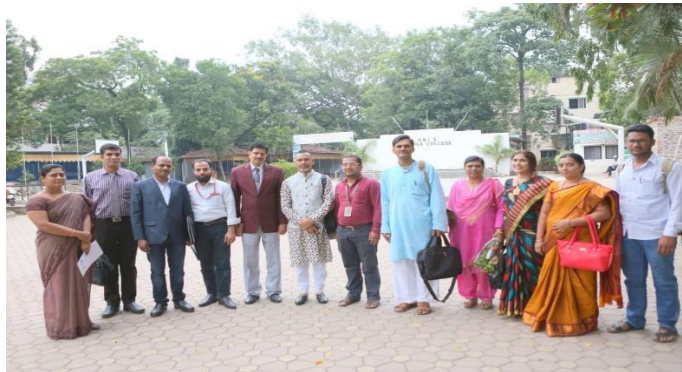
अन्तर्राष्ट्रीय संगोष्ठी में सम्मिलित विद्वानों के साथ