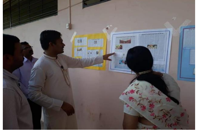
मोरिशस के ११ वें विश्व हिंदी सम्मेलन पर आधारित भित्तिपत्रकों का विमोचन एवं प्रदर्शन