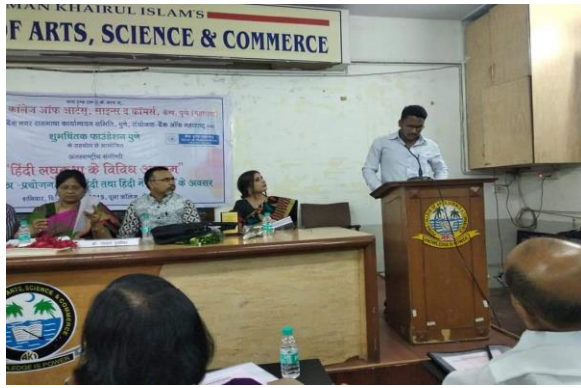
अन्तर्राष्ट्रीय हिन्दी संगोष्ठी में शोधालेख पठन करते हुए