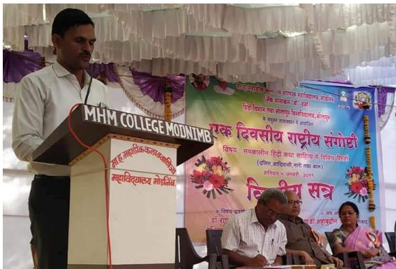
महाडिक महाविद्यालय मोड़निम्ब की राष्ट्रीय संगोष्ठी में शोधालेख पठन करते हुए