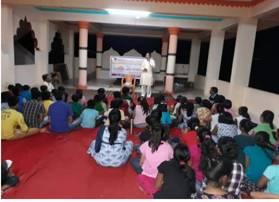
गुरुकुल रामलिंग, येडशी में आयोजित बाल संस्कार शिबिर छत्रपति शिवाजी महाराज का बचपन विषय पर व्याख्यान