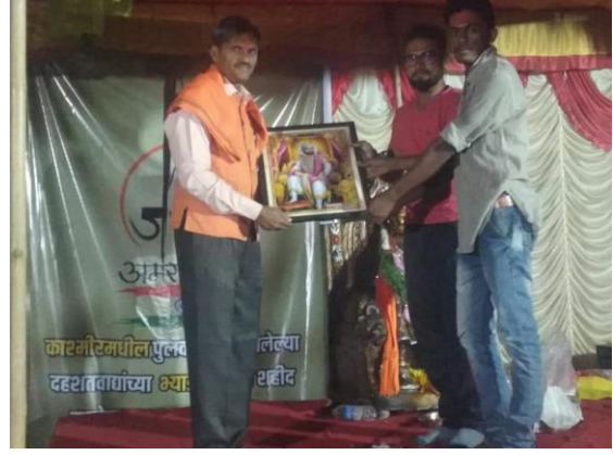
ग्राम बावी, ता. जि. उस्मानाबाद में शिवजयंती के अवसर पर छत्रपति शिवाजी महाराज की रणनीति विषय पर व्याख्यान