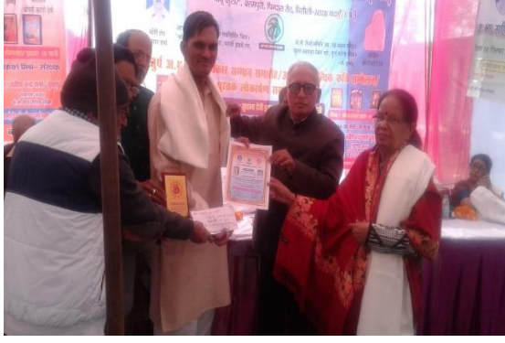
साहित्य भूषण श्री पुरस्कार सम्मान