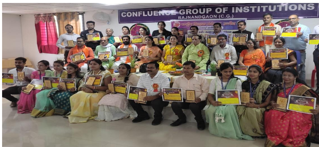
संत कबीर पुरस्कारार्थियों के साथ समूह चित्र