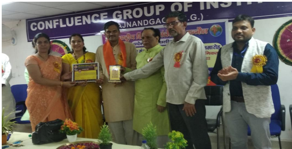
संत कबीर पुरस्कार ग्रहण करते हुए