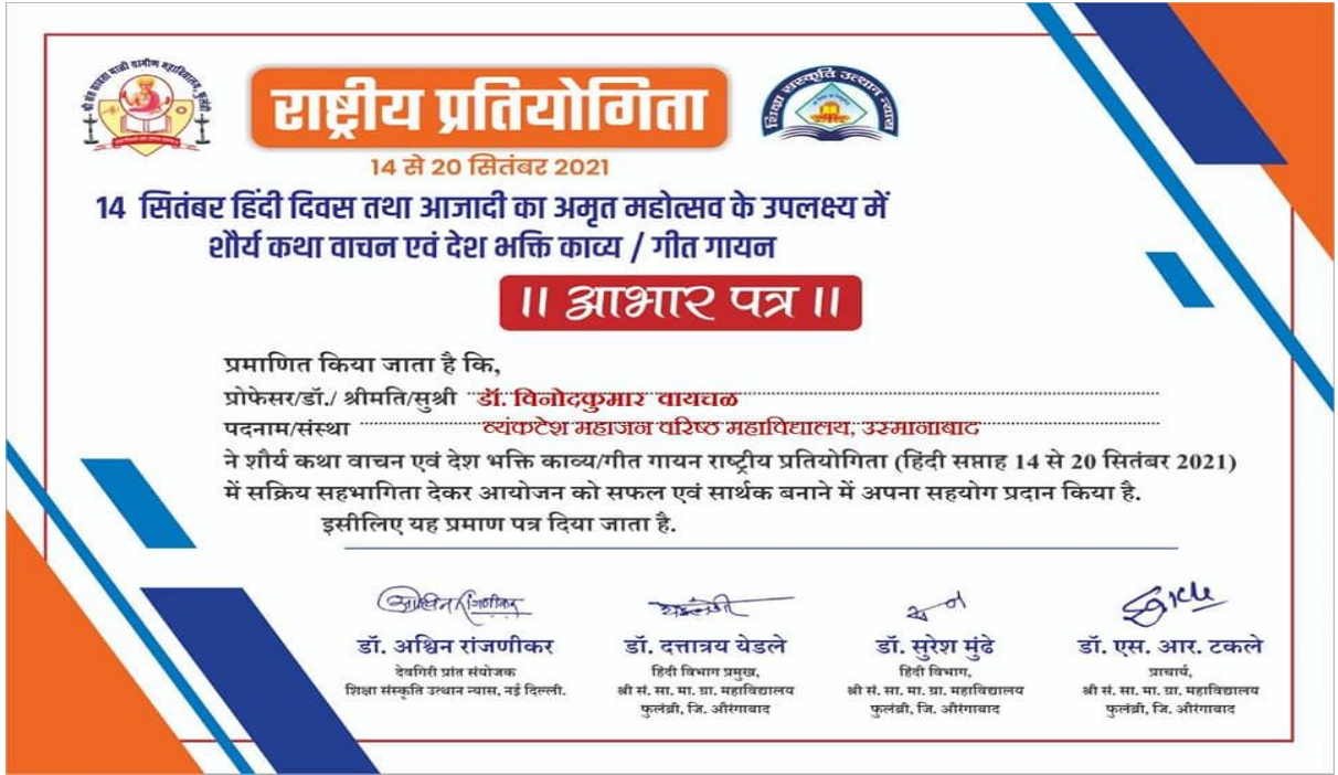
आजादी का अमृत महोत्सव आभासी सहभाग प्रमाणपत्र