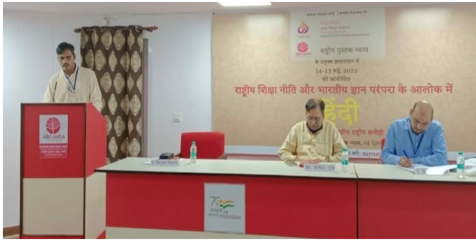
द्वितीयक कक्षाओं के लिए पाठ्यपुस्तक निर्मिती विषय पर व्याख्यान