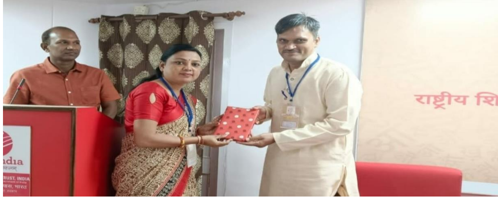
राष्ट्रीय शिक्षा नीति और भारतीय ज्ञान परम्परा के आलोक में हिंदी संगोष्ठी में स्वागत