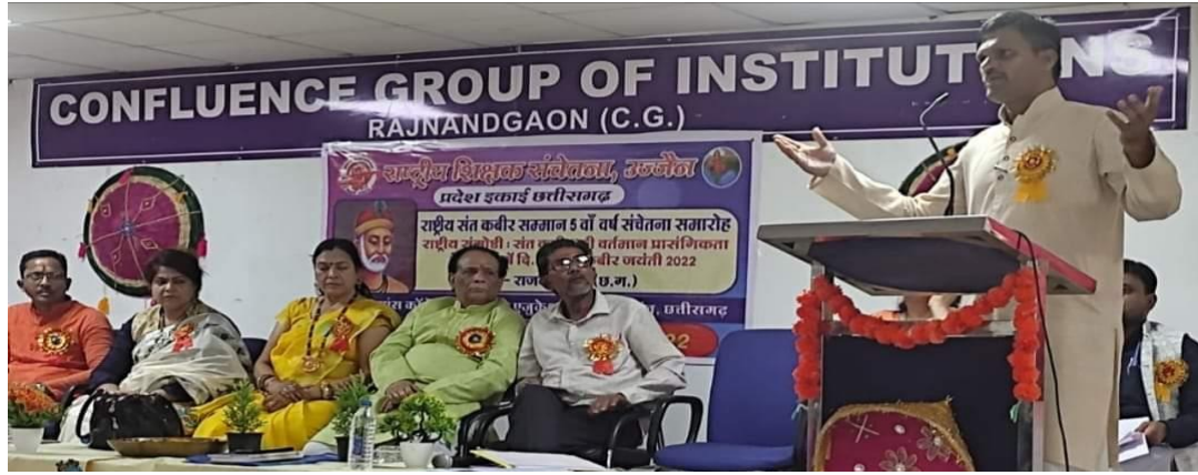
संत कबीर की शब्द साधना विषय पर व्याख्यान देते हुए