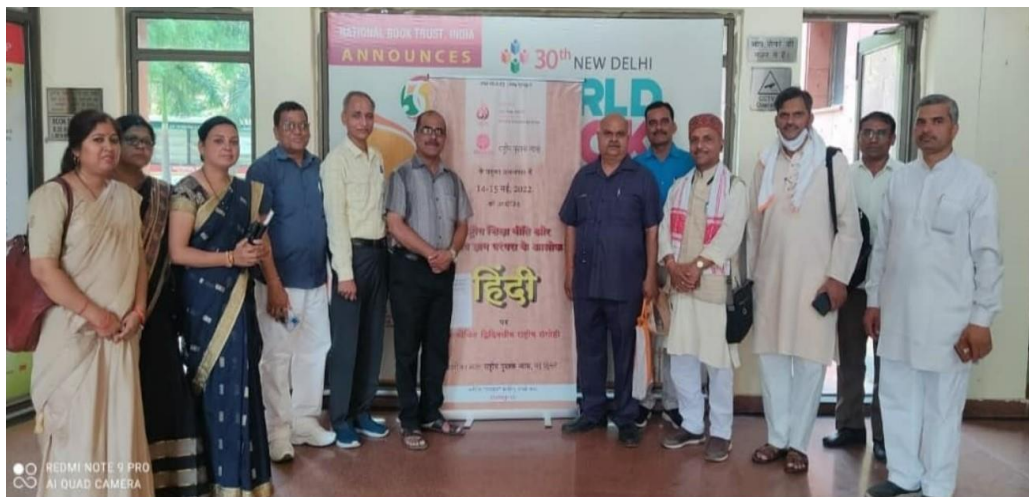
राष्ट्रीय पुस्तक न्यास, नई दिल्ली के भवन में विद्वज्जनों के साथ