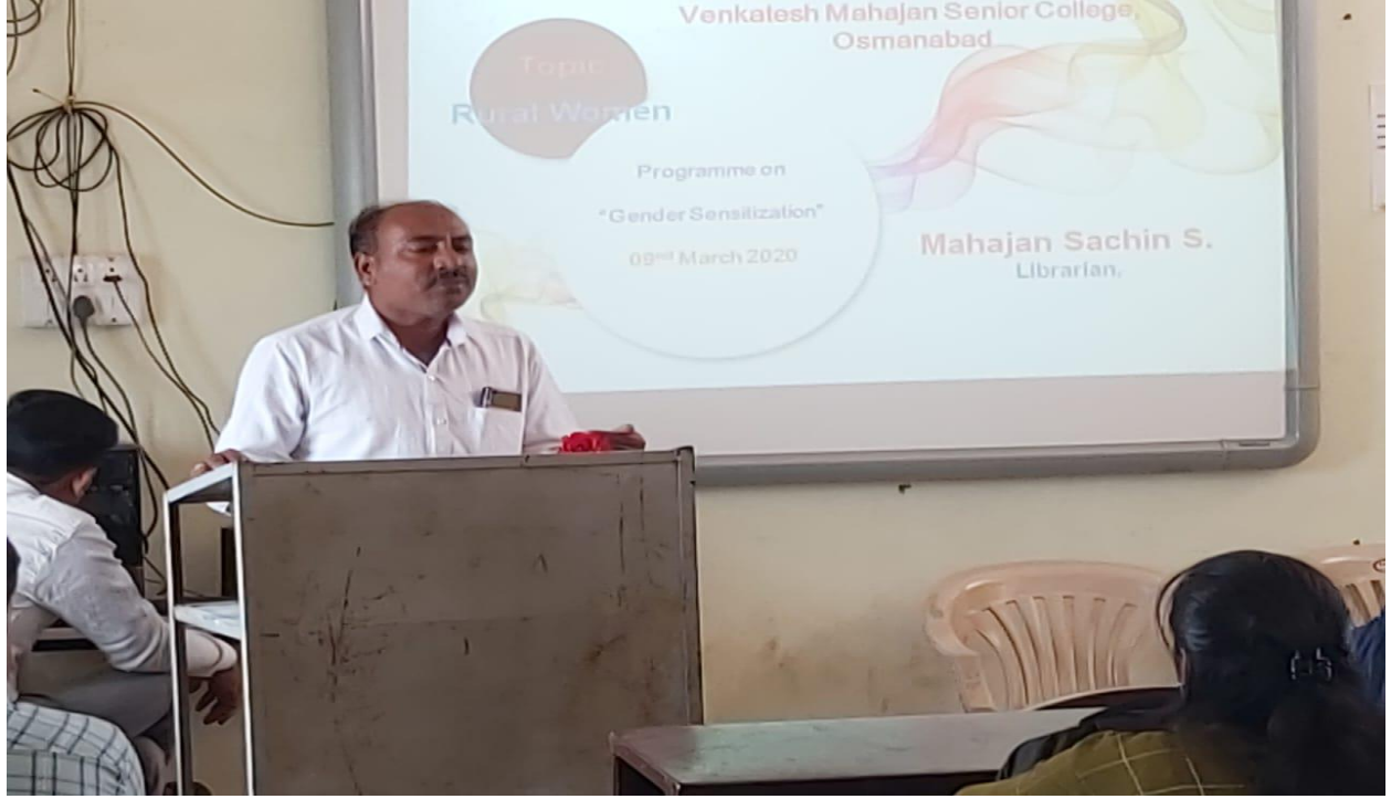
महिला कक्ष, महिला व लिंगभाव समानता विकास कक्ष द्वारे जागतिक महिला दिनानिमित्त आयोजित 'लिंगभाव समानता' विषयक चर्चा व मार्गदर्शन कार्यक्रमात उपस्थित विद्यार्थी आणि कर्मचारी