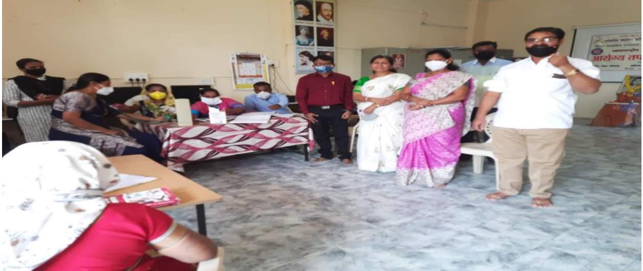
जागतिक महिला दिनानिमित्त समिती आयोजित विद्यार्थी-कर्मचारी आरोग्य तपासणी शिबीर-ताभार्थी विद्यार्थी व कर्मचारी. दि. ०८.०३.२०२१