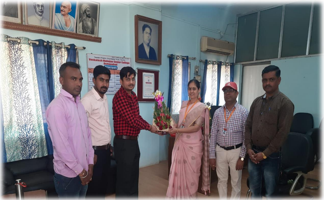
आरोन्य तपासणी शिबीर उद्घाटन प्रसंगी CIVIL HOSPITAL, OSMANABAD चे श्री. यतोड व MAHA-LAB चे कर्मचारी दि. ०८/०३/२०२३