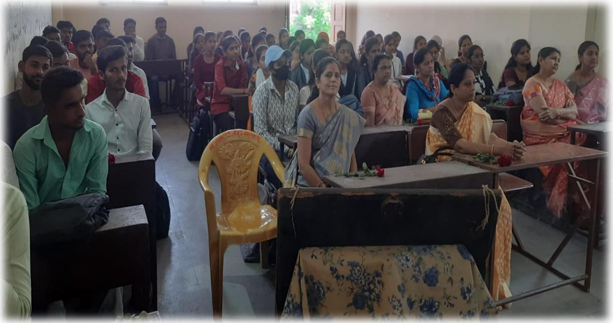
आरोन्य तपासणी शिबीर उद्घाटन प्रसंगी “GENDER EQUITY” विषयावर संवाद – उपस्थित विद्यार्थी, अध्यापक व शहयातील महिला दि. ०८/०३/२०२३